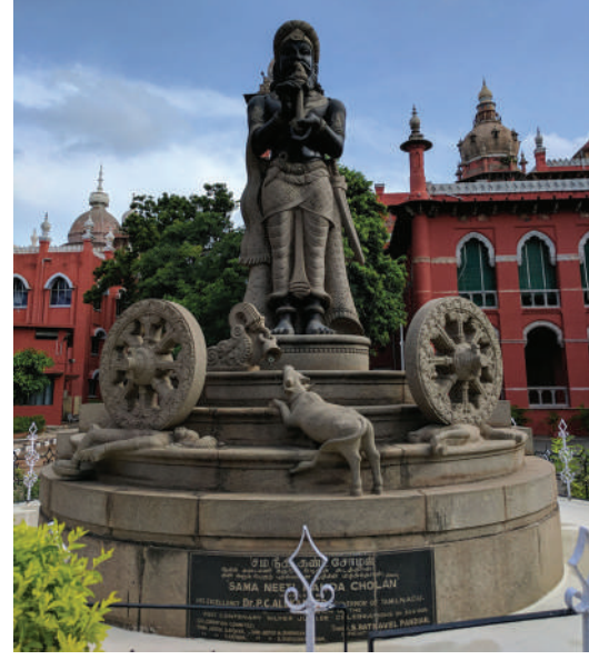
மெட்ராஸ் உயர் நீதிமன்றத்தில் சம நீதி கண்ட சோழன் சிலை

எதிர்காலத்தில் எழும் கேள்விகளுக்கு தீர்வாக கடந்த கால தீர்ப்புகள் உதவுகின்றன. இதனால் உயர் நீதிமன்றம் பதிவேடுகளின் நீதிமன்றமாக செயல்படுகிறது.