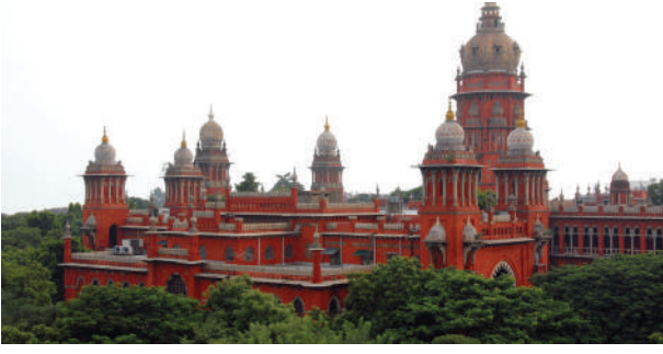
மெட்ராஸ் உயர் நீதிமன்றம்

தோற்றுவிக்க வழிவகுக்கிறது. ஆனால் 1956ஆம் ஆண்டு ஏழாவது திருத்தச்சட்டம், இரண்டு மற்றும் இரண்டிற்கு மேற்பட்ட மாநிலங்கள், யூனியன் பிரதேசங்களுக்கென்று ஒரு பொதுவான உயர் நீதிமன்றத்தை நிறுவ நாடாளுமன்றத்திற்கு அங்கீகாரம் வழங்கியது.